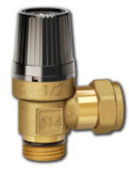
LK 514 MultiSafe