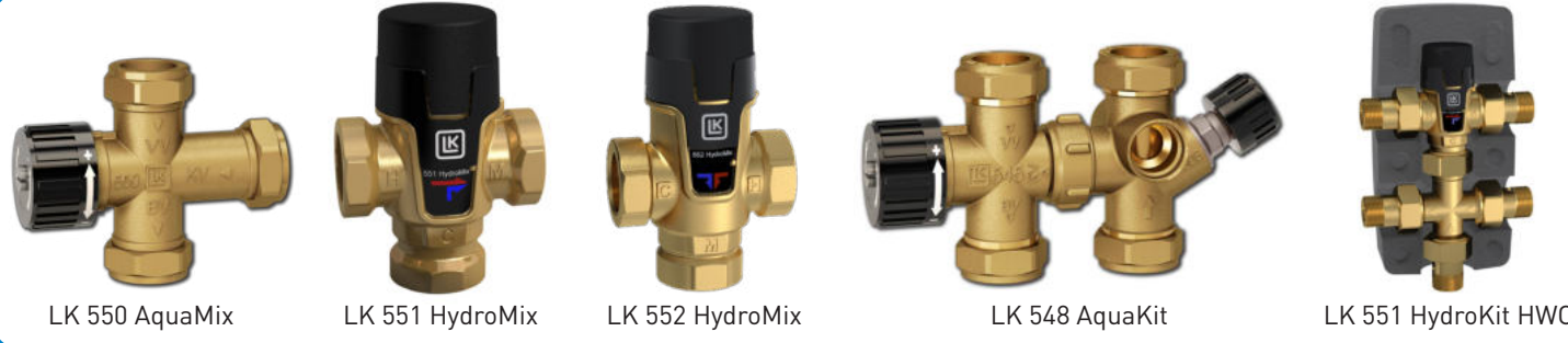
LK 550 AquaMix