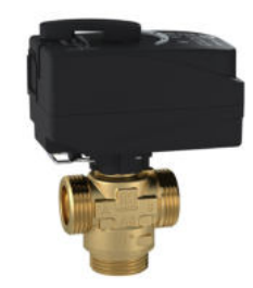
LK 525 MultiZone 3R