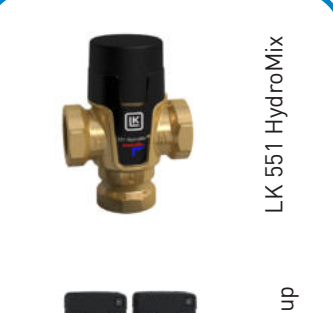
LK 551 HydroMix