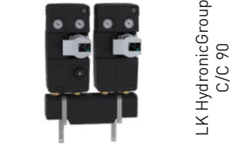
LK HydronicGroup C/C 90