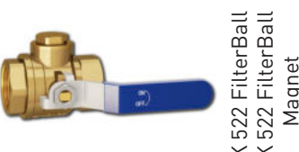
LK 522 FilterBall Magnet