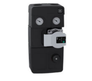
LK HydronicGroup 90 C