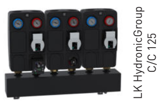
LK HydronicGroup C/C 125