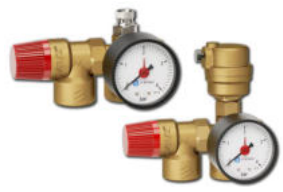
LK 924/925 SafetyGroup