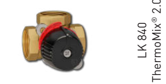
LK 840 ThermoMix® 2.0