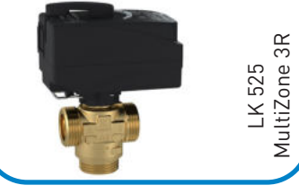
LK 525 MultiZone 3R