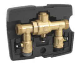
LK 521 MultiFill®