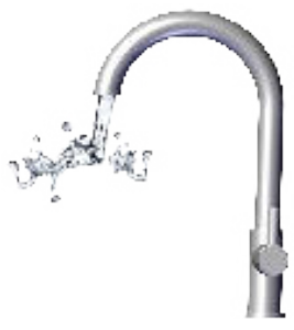
LK 551 HydroKit HWC