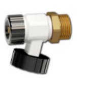
LK 905 Drain valve